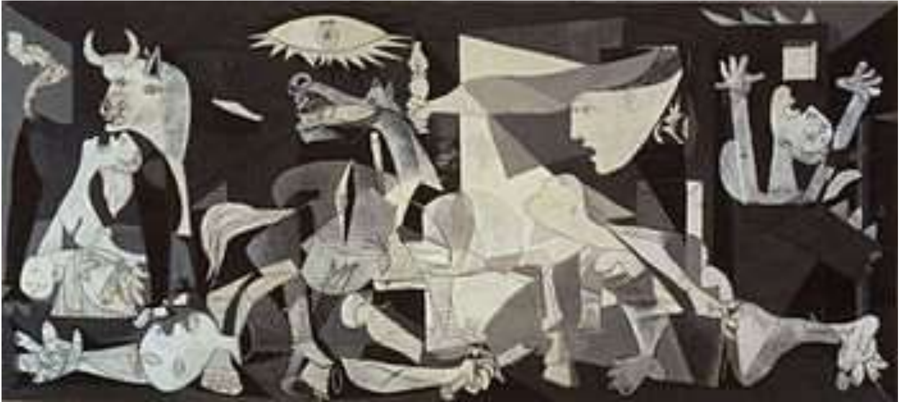
Gernika, 1937 m.(7,8x3,5 m)