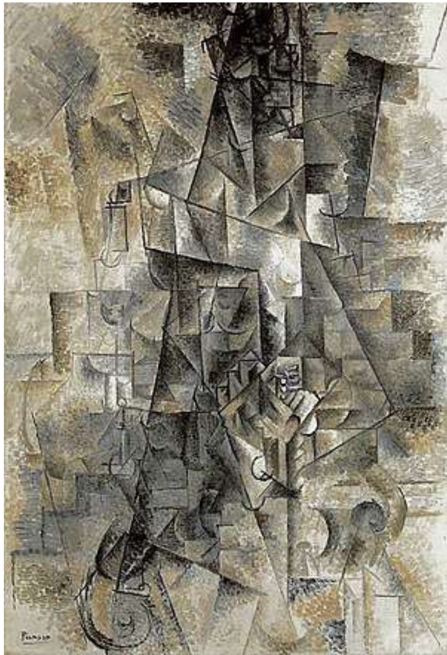
Akordeonistas, 1911 m.