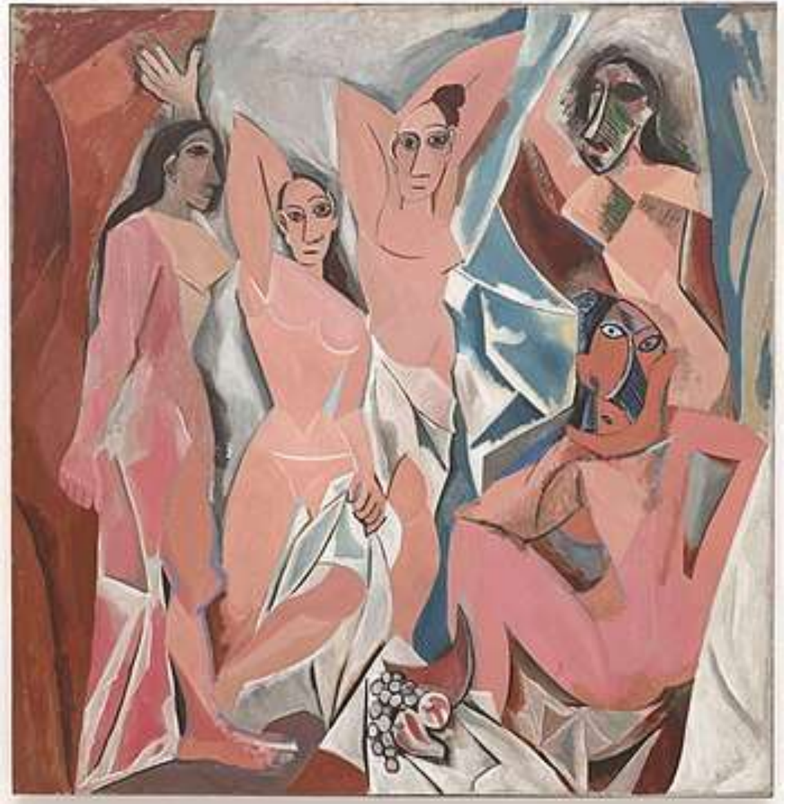
Avinjono merginos, 1907 m.