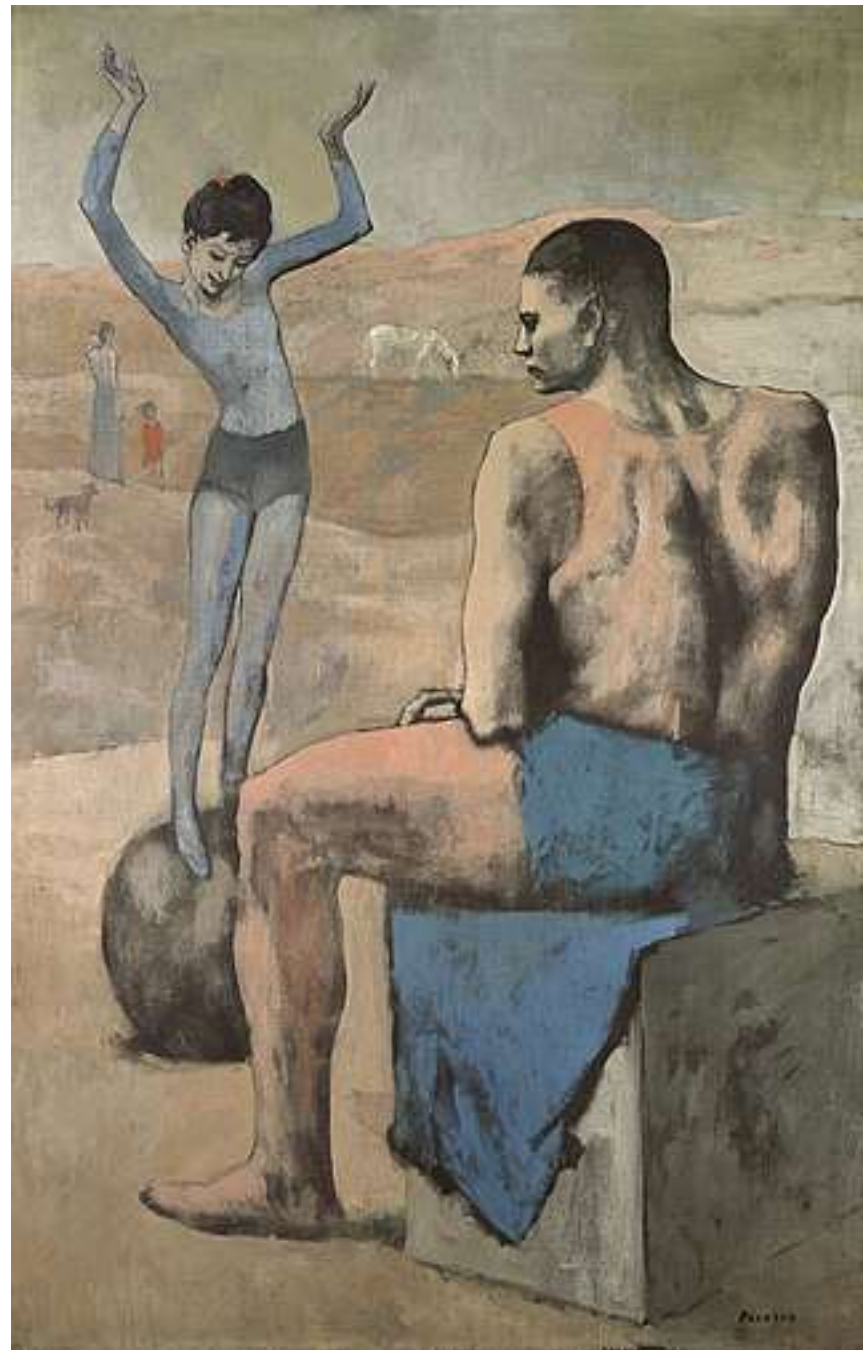
Mergaitè ant rutulio, 1905 m.