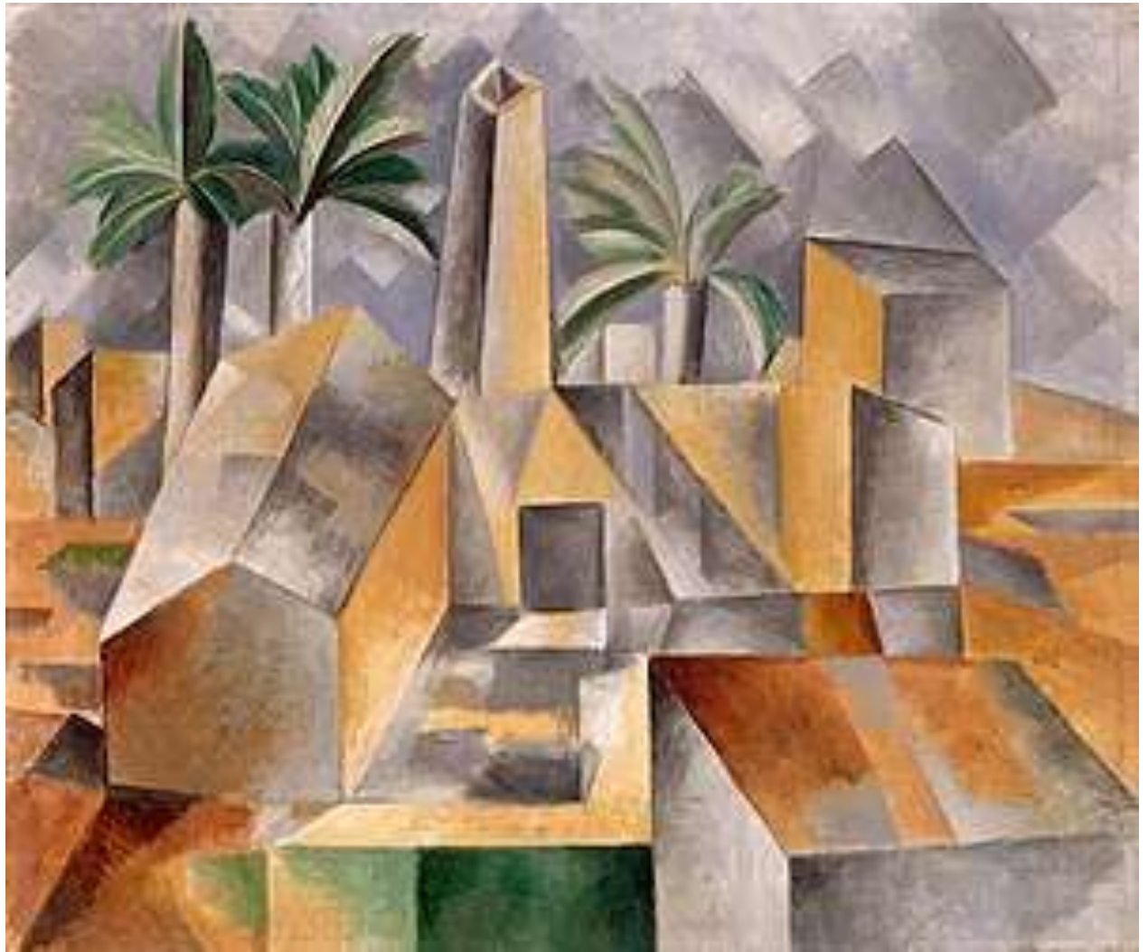
Plytų fabrikas Tortose, 1909 m.