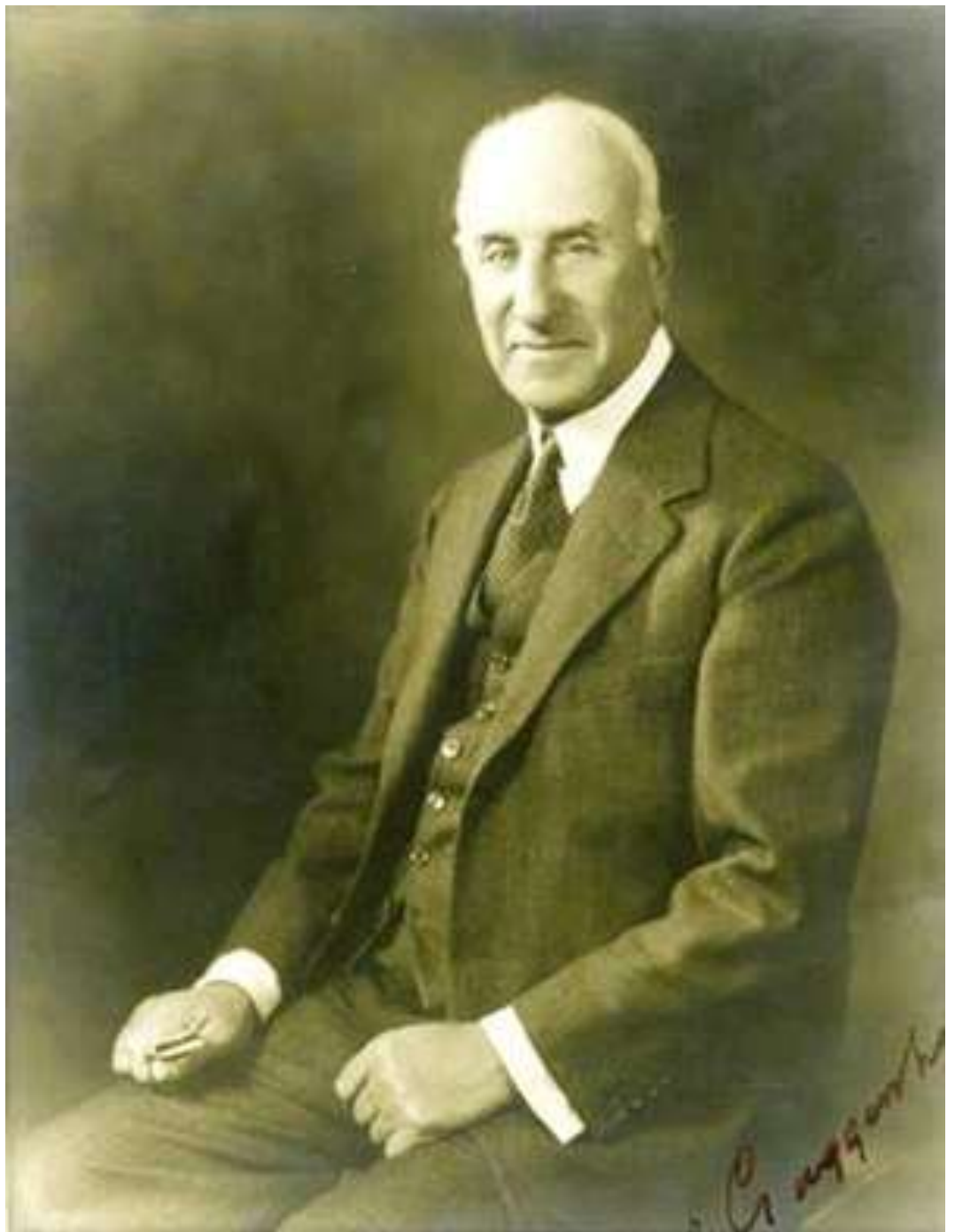
Solomon R. Guggenheim (1861-1949)