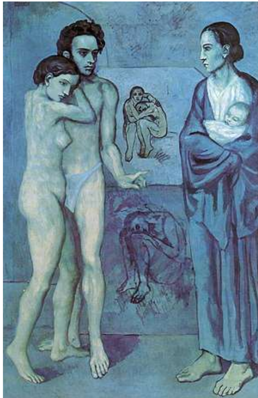
Pablo Pikastas. Gyvenimas, 1903 m.