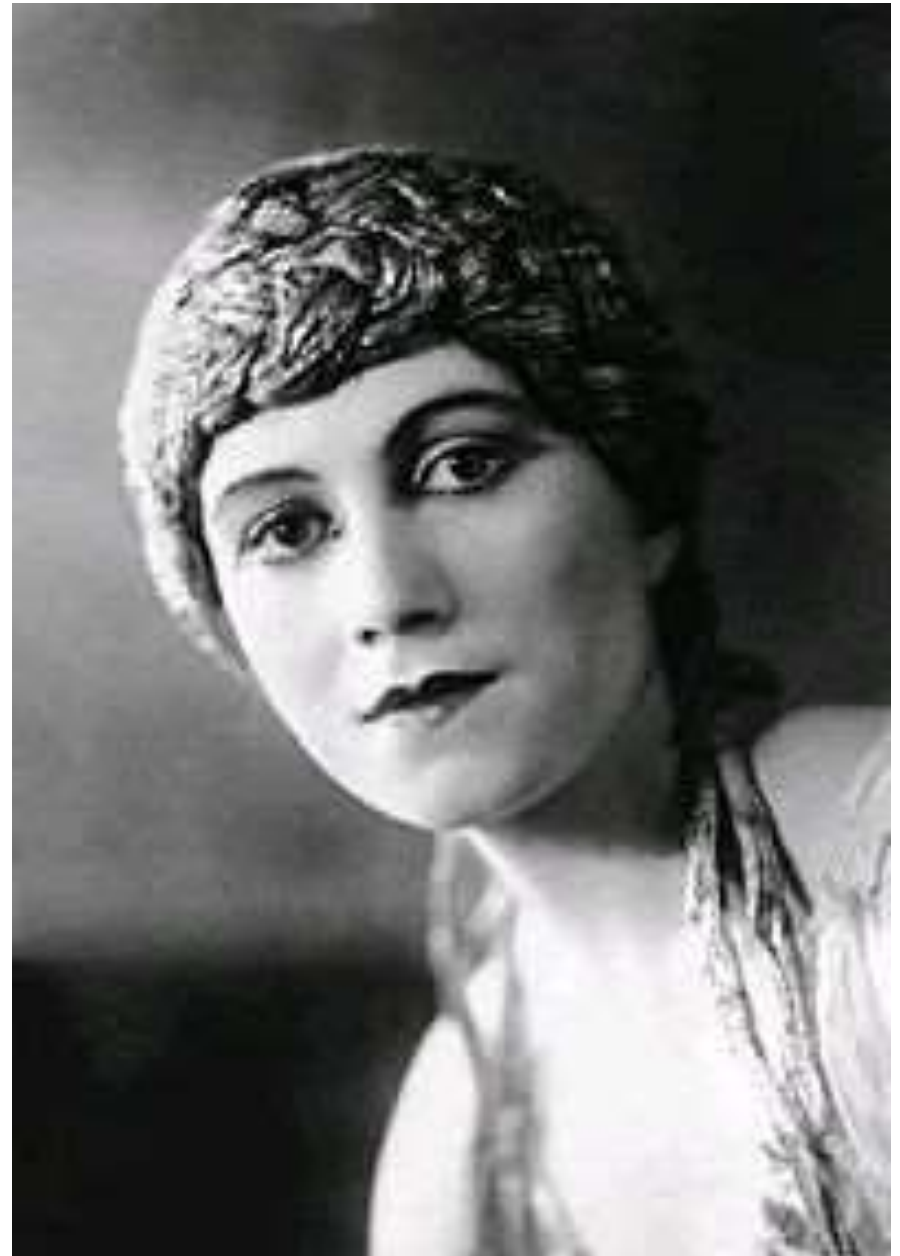
Olga Chochlova (1891-1955)