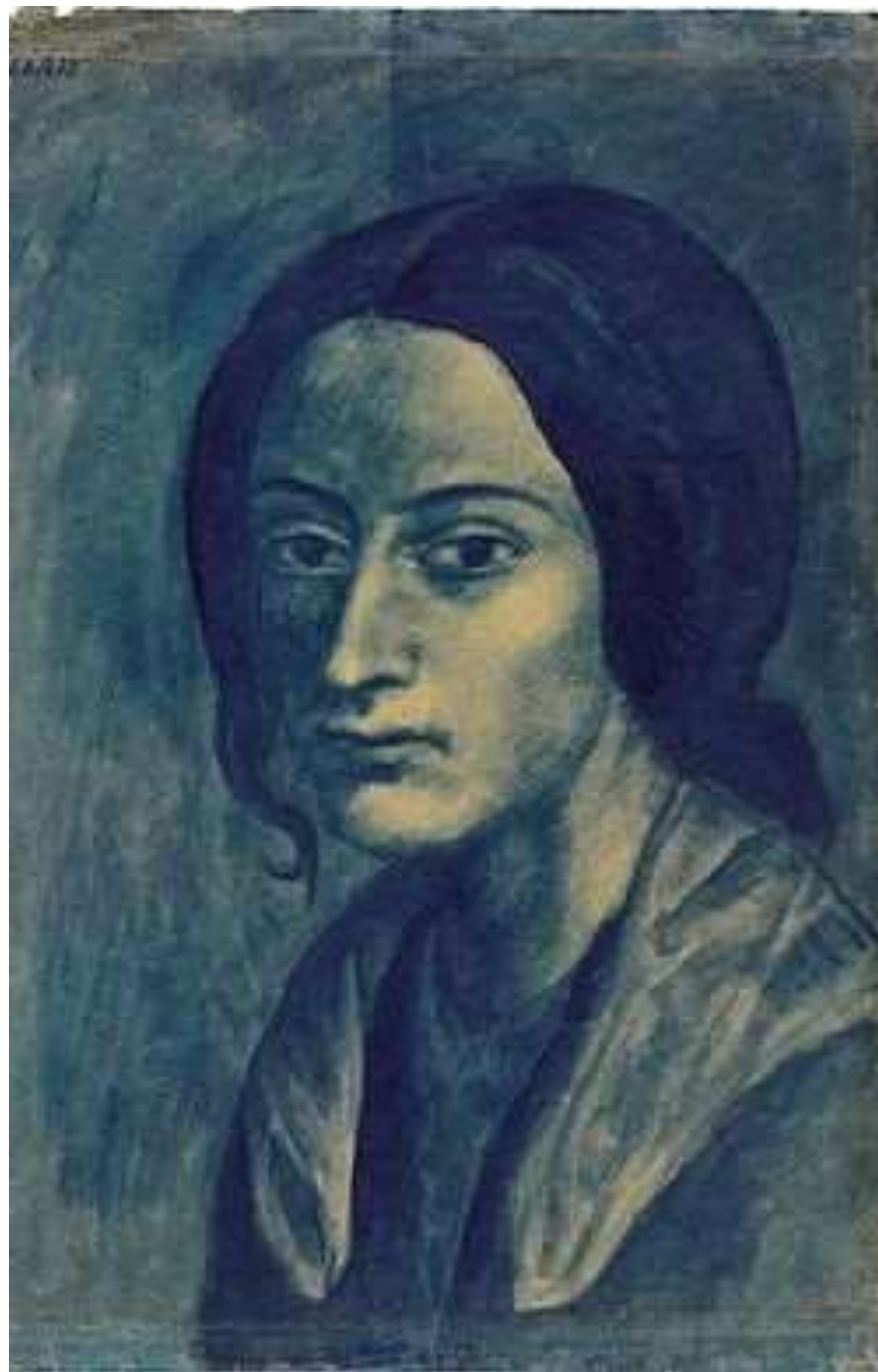
Moteris su kuodeliu, 1903 m.