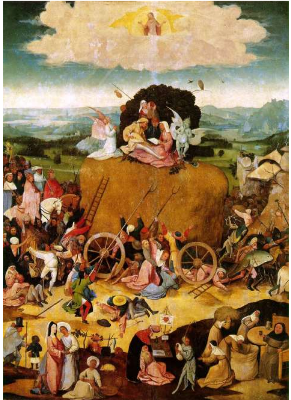
J. Boschas. Šieno vežimas, 1500 m.