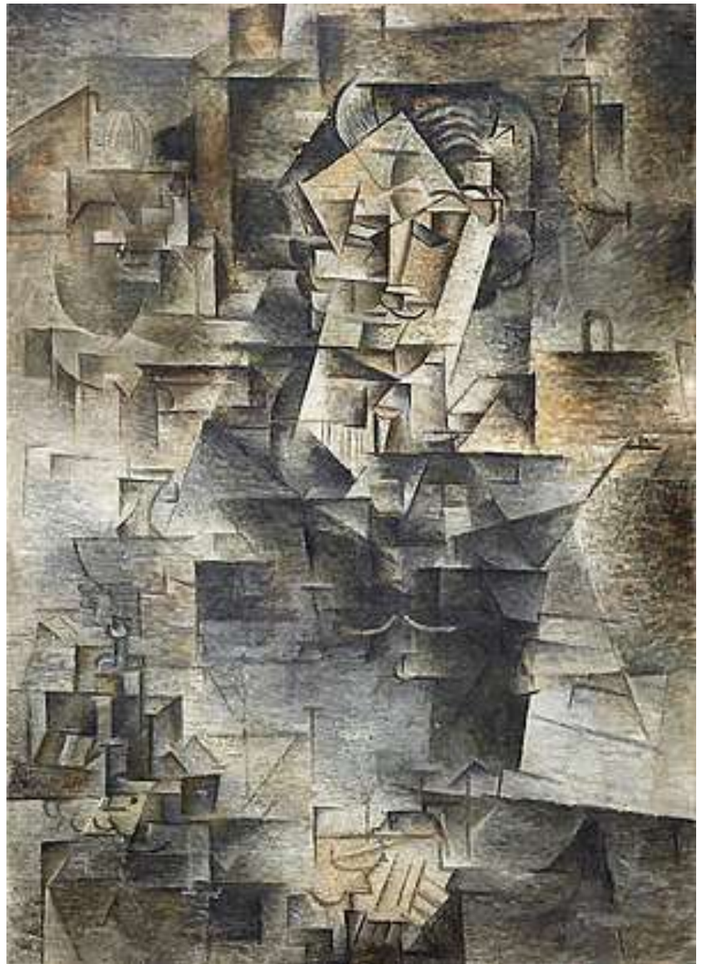
Danieliaus Anri Konveilerio portretas, 1910 m.