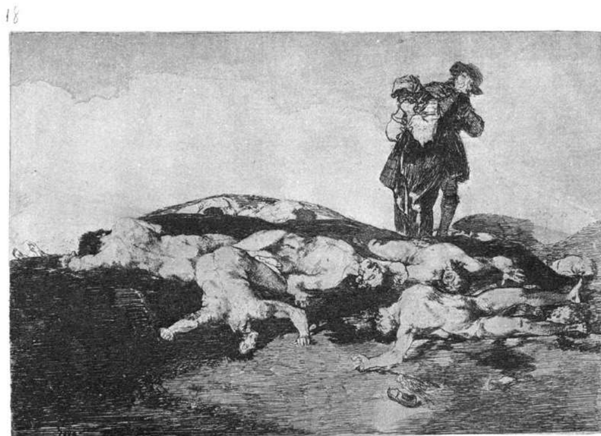
Enterrar y callar.

F. Goja. Laidoti ir tylēti. Iš ciklo “Karo nelaimēs”, 1810-1820 m.