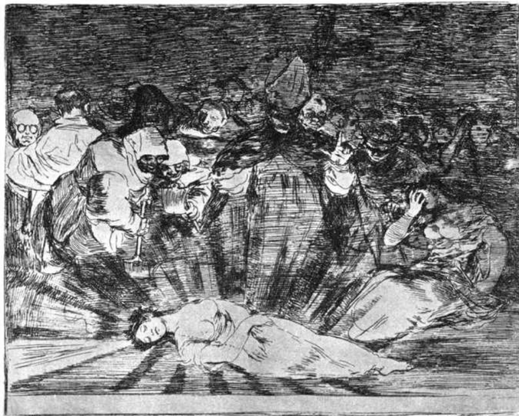
Murió la Verdad.